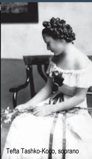
Tefta Tashko-Koco, soprano