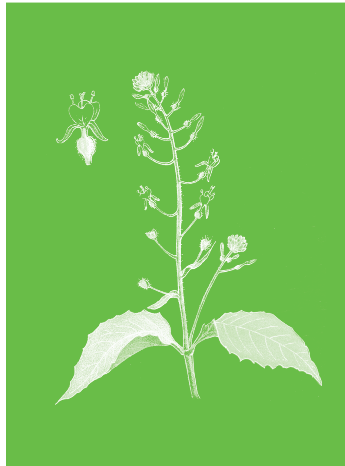
Circée de Paris Circaea Lutetiana

En dépit de son nom, qui rappelle celui de la célèbre magicienne qui transforma en pourceaux les compagnons d'Ulysse, la Circée ne possède bien entendu aucune vertu magique.