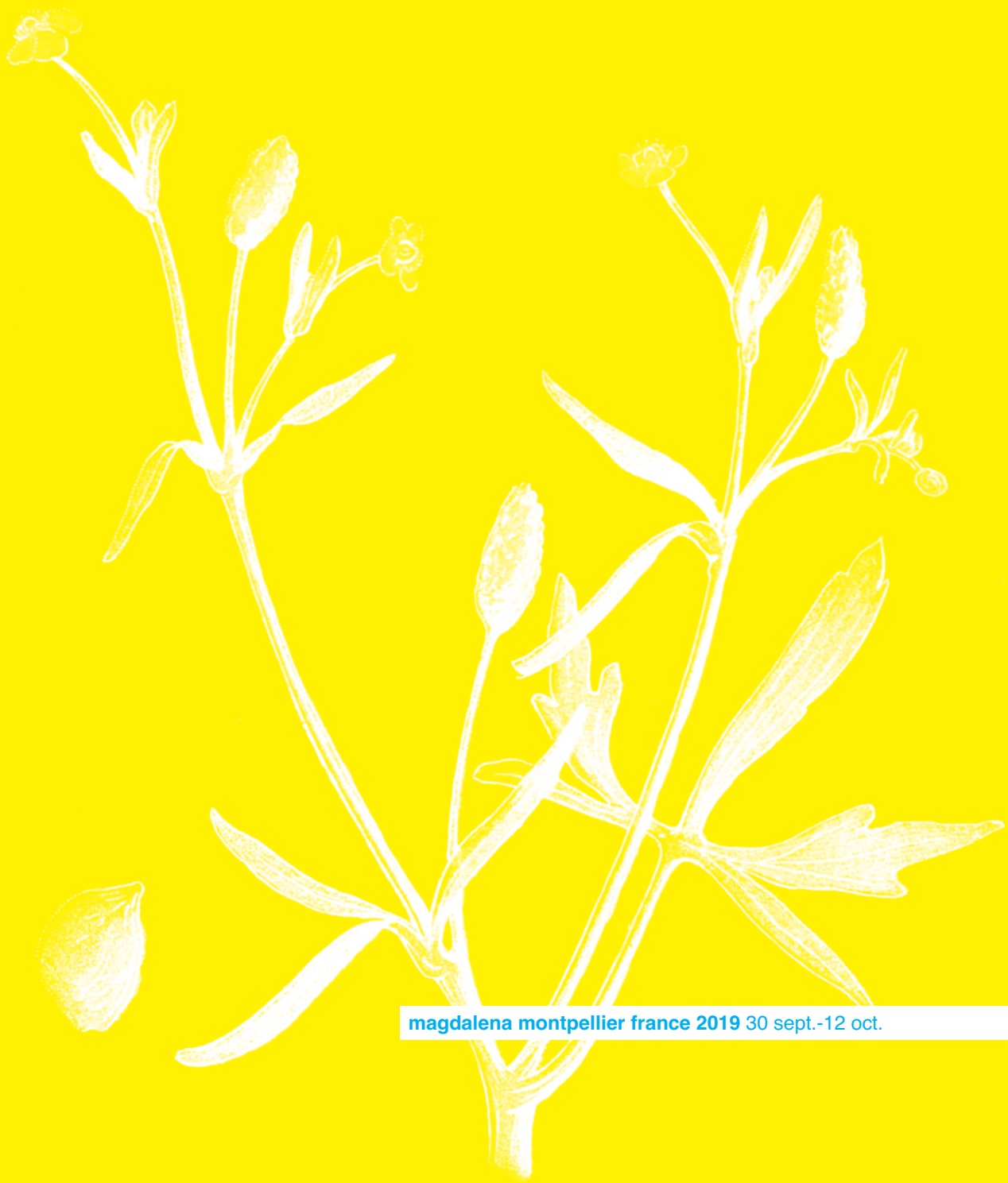
magdalena montpellier france 2019 30 sept.-12 oct.