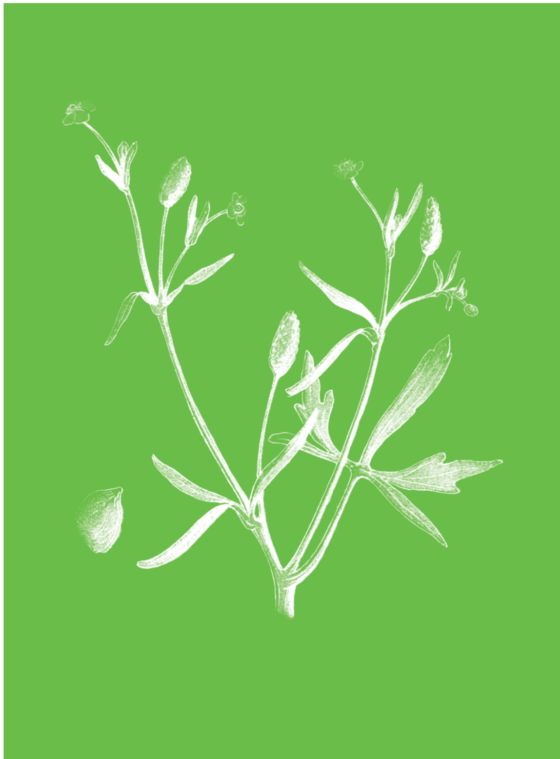
Renoncule scélérate Ranunculus sceleratus

On a dit que sa simple émanation amenait les larmes ; que ses qualités vénéneuses produisaient une contraction particulière des muscles de la face, que les anciens appelèrent rire sardonique . Nous avouons que nous n'avons jamais éprouvé les effets d'une plante qui ferait à la fois rire et pleurer.